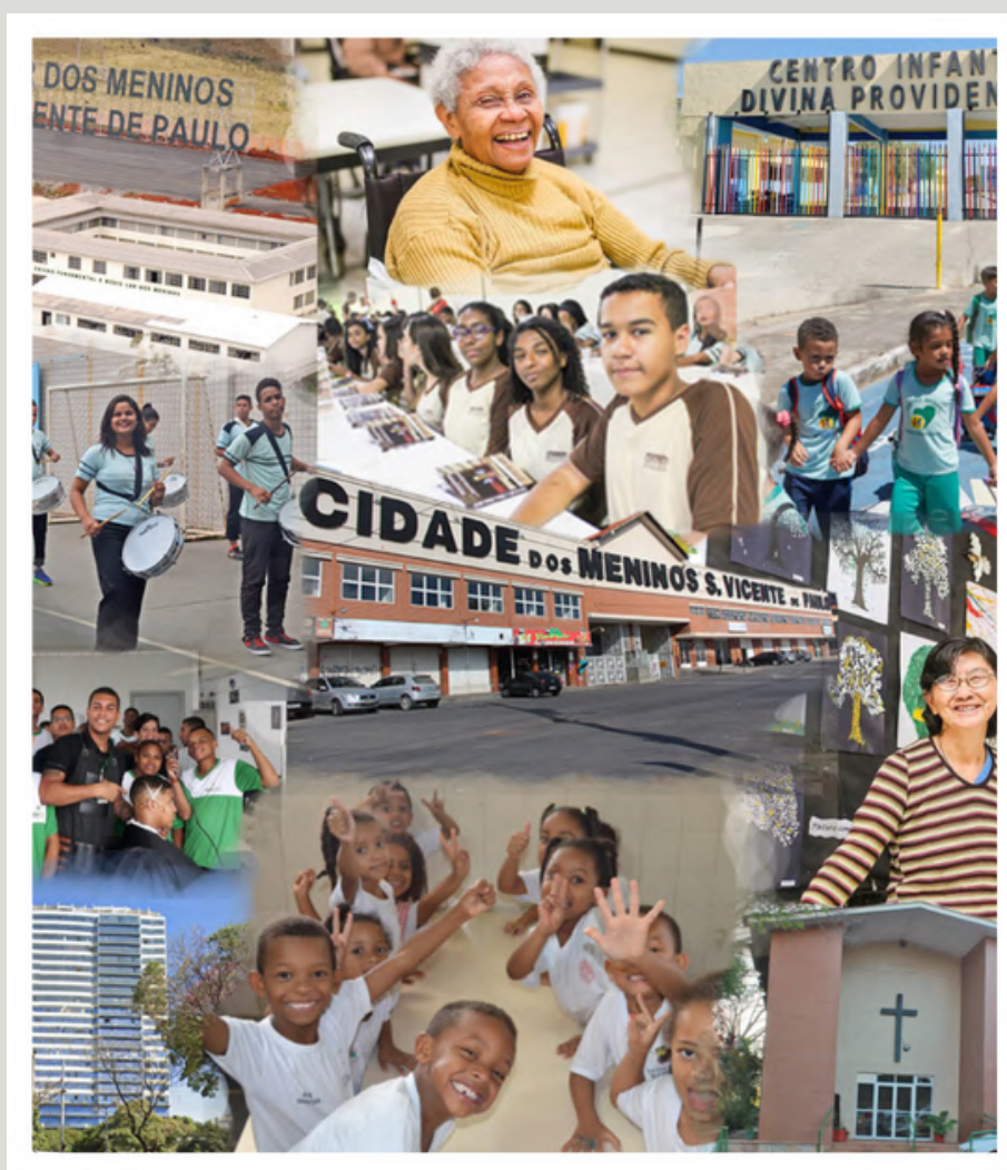
Foto: Cidade dos Meninos São Vicente de Paulo. A Confins Transporte é parceira da Instituição.

A Confins Transportes incentiva a participação de seus funcionários em programas de voluntariado.